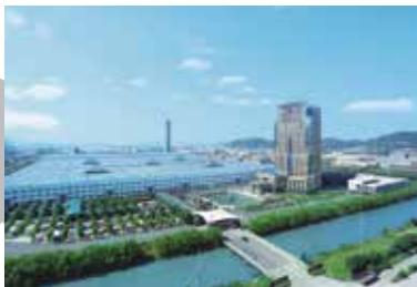
Trụ sở Tập đoàn Haitian International