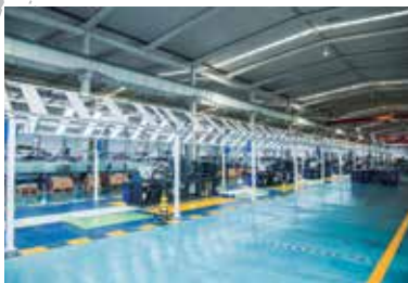
Dây chuyền tự động hoá - Haitian Plastics