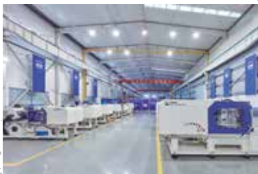
Trung tâm thử khuôn - Zhafir